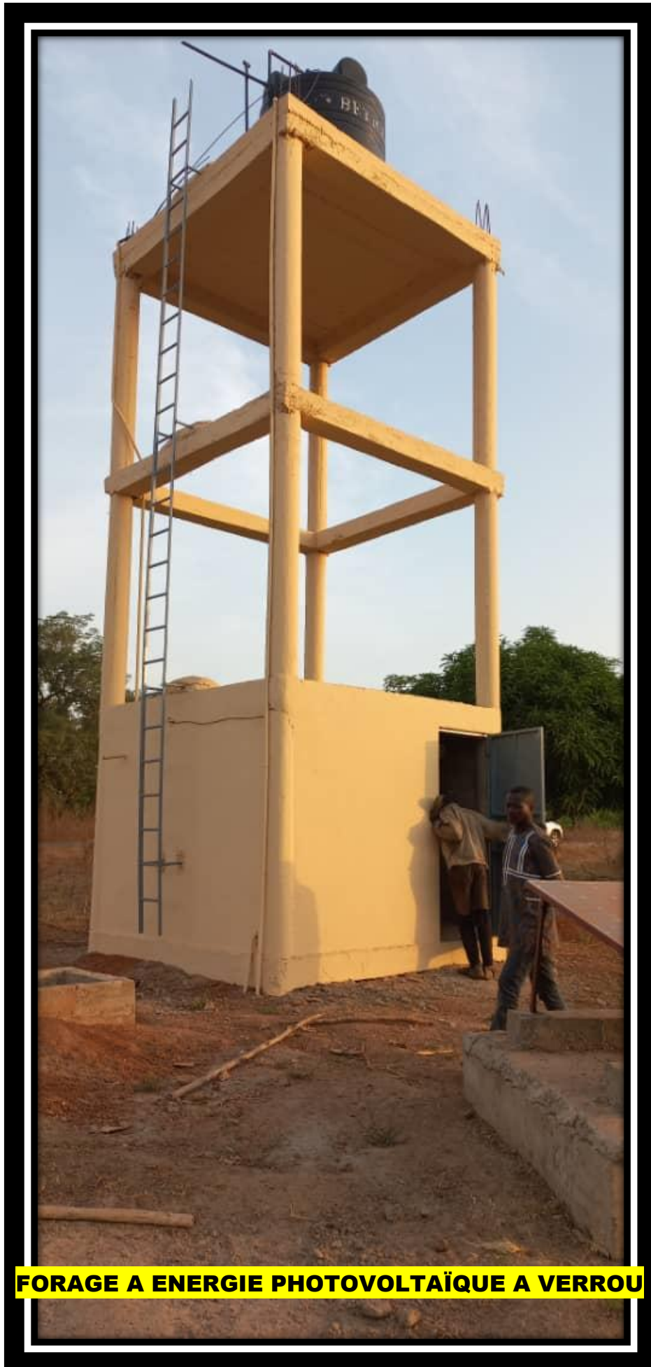
FORAGE A ENERGIE PHOTOVOLTAÏQUE A VERROU